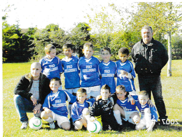
les poussins...du F.A.B.