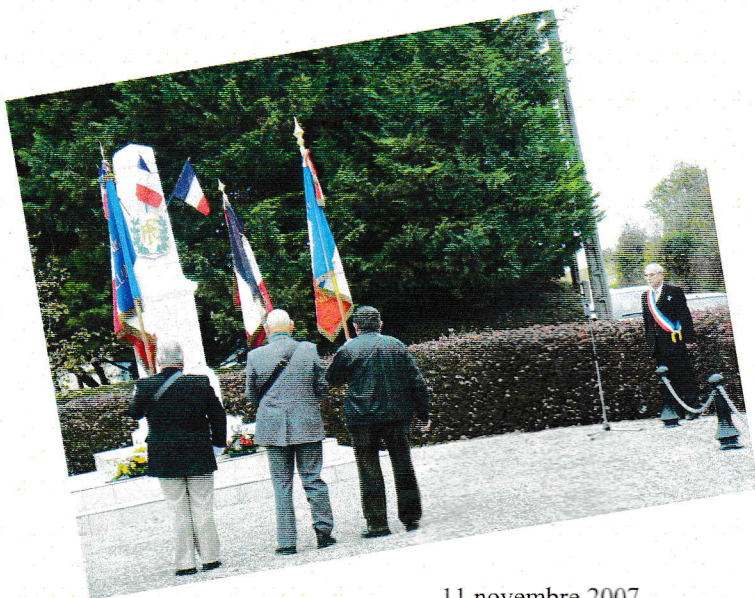
11 novembre 2007