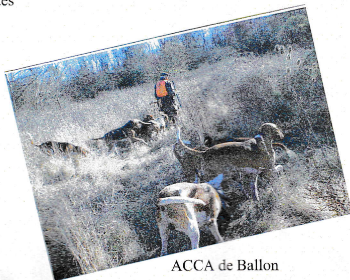
ACCA de Ballon