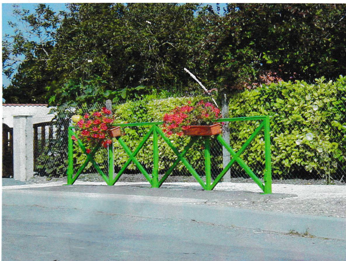
Le pont béni