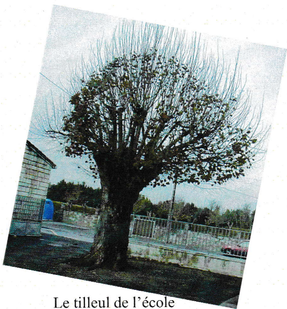
Le tilleul de l'école