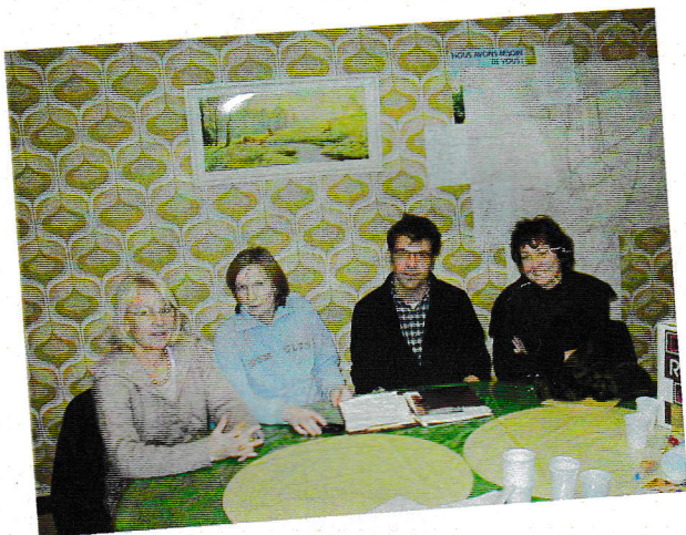
Le comité des fêtes Le bureau